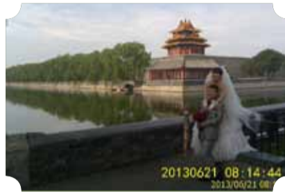
● 作品：京喜让历史见证 ● 作者：督察队 刘忠华