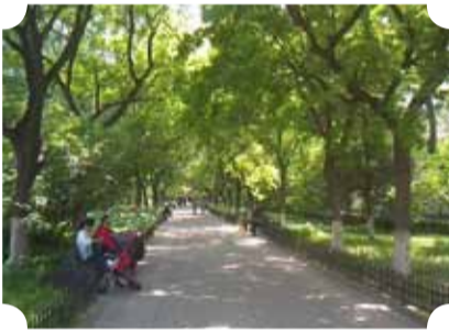
● 作品：林荫大道 ● 作者：三中队 郭秀红

构图工整，主体在画面的左侧三分之一位置符合三分构图的黄金比例，L型的路边竖砖形成的引导线更加把主体凸显出来，雨后凌乱的地面，老人的身影和身后整洁的地面形成鲜明的对比，腿部虚化动感，体现出了老人的奉献，勤劳和文明之美。