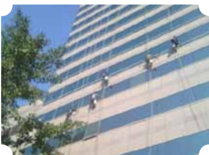
● 作品：辛勤劳动者-蜘蛛人 ● 作者：四中队 师泽

背景的标语与主题呼应，动作自然感人，在老龄化社会到来之际，城市文明更应体现在人文文化的体贴上。文明社区是新东城的基石，很高兴看到东城区在社区文化建设上的进步与发扬。