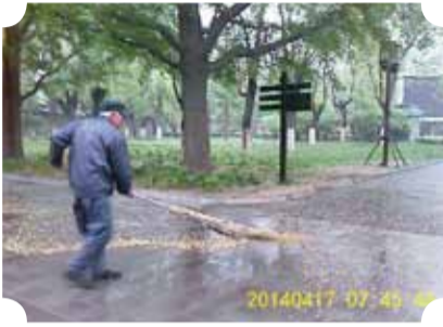
● 作品：勤劳 ● 作者：一中队 勾晓莉

构图工整，主体在画面的左侧三分之一位置符合三分构图的黄金比例，L型的路边竖砖形成的引导线更加把主体凸显出来，雨后凌乱的地面，老人的身影和身后整洁的地面形成鲜明的对比，腿部虚化动感，体现出了老人的奉献，勤劳和文明之美。