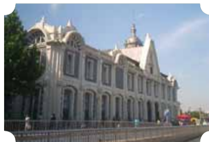
● 作品：速度与激情 ● 作者：四中队 吴景莲