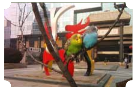
● 作品：相亲相爱 ● 作者：三中队 曾宪尧