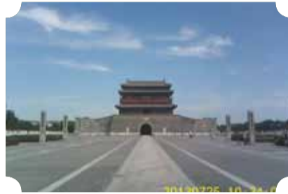
● 作品：东城美丽一角 ● 作者：五中队 满运杰