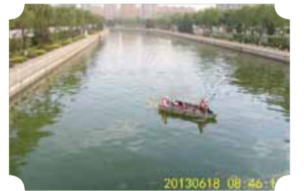
● 作品：清新 ● 作者：四中队 孙志勇