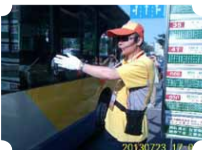
● 作品：站牌标兵 ● 作者：四中队 孙志勇

画面简洁，表情自然，用最平凡的题材去表现不平凡的文明和心灵美。环卫工人全副武装，用她们辛劳和汗水来美化着这个城市，她们才是这个城市伟大的美容师。