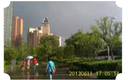
● 作品：雨后街景 ● 作者：督察队 安元