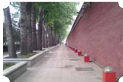
● 作品：绿荫红墙 ● 作者：二中队 张子信