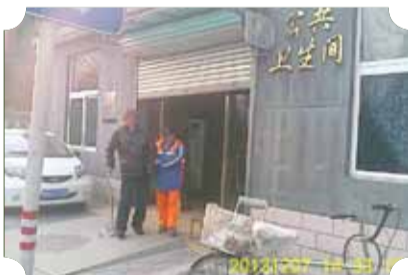
● 作品：关爱 ● 作者：五中队 杨德武