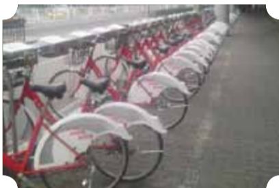
● 作品：低碳出行 ● 作者：一中队 范雪冬