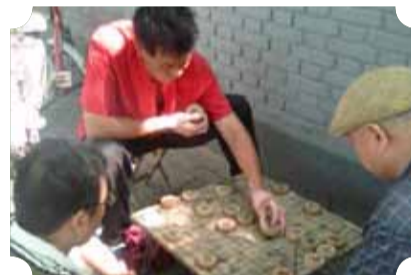
● 作品：路边的对决 ● 作者：二中队 杨立贤