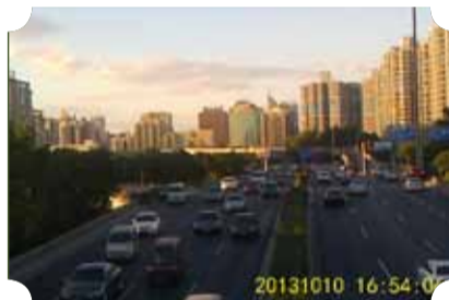
● 作品：黄昏 ● 作者：四中队 谢贺岗