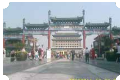
● 作品：速度与激情 ● 作者：四中队 吴景莲