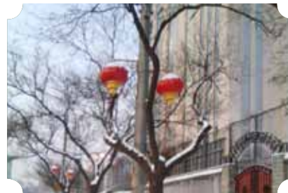
● 作品：美丽前门 ● 作者：四中队 王丽梅