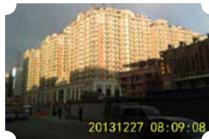
● 作品：靓丽富贵园 ● 作者：四中队 张春江