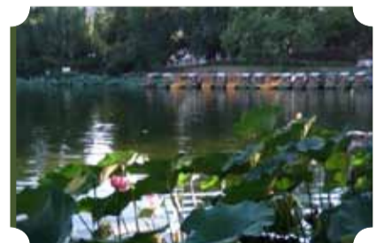
● 作品：心灵的平静 ● 作者：一中队 刘海坊