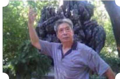
● 作品：晨练 ● 作者：二中队 崔亚文