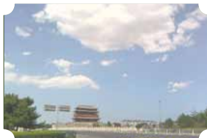
● 作品：蓝天白云 ● 作者：督察队 郭秀侠