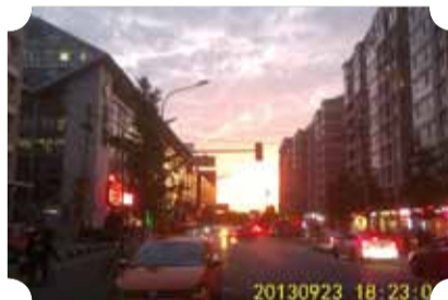
● 作品：火烧云下的兴隆街 ● 作者：四中队 柴卫东