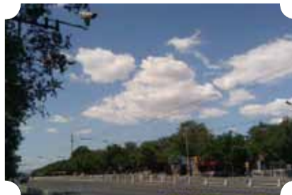
● 作品：蓝天白云 ● 作者：督察队 黄源