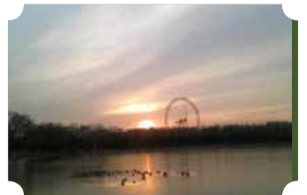
● 作品：无题 ● 作者：五中队 张长军