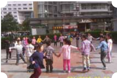
● 作品：欢乐童年 ● 作者：四中队 徐振国