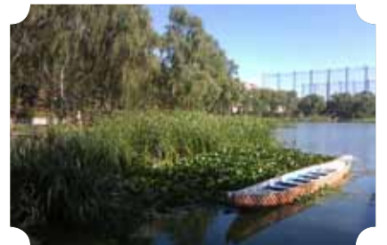
● 作品：一叶孤舟 督察队 ● 作者：熊文华