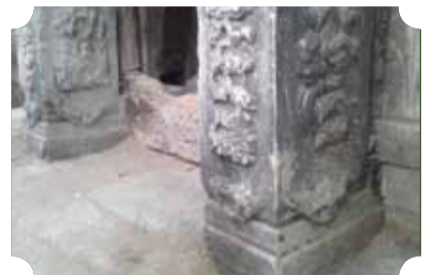
● 作品：无题 ● 作者：五中队 郝永芹