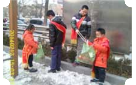
● 作品：环保小卫士 ● 作者：四中队 王春红